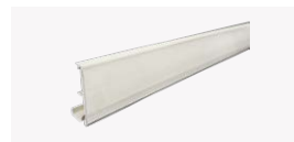
Porta precio para estante