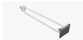
Soporte de Blister p/fondo Perforado